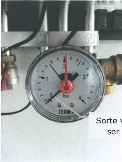
Sorte vi- ser